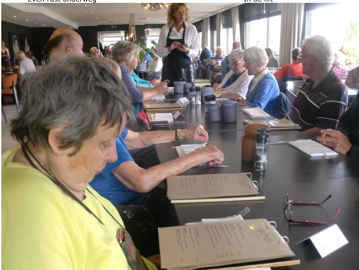
Aan de lunchtafel