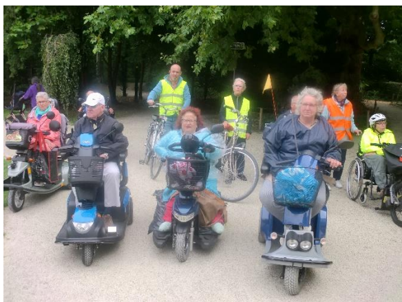
Even rust onderweg