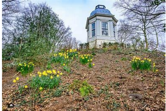
theekoopel op heuvel

Na enkele vroege buien trekt de wolkenlucht open en als we de weerprofeten mogen geloven zal er deze dag in Leiden en omgeving geen drup regen meer vallen. We gaan dan ook met een opgewekt gevoel naar de startplaats voor de tocht van vandaag. Gekozen is om te starten aan de voorzijde van het LUMC. Zeven personen die met een scootmobiel rijden hebben zich als deelnemers voor deze rit opgegeven. Voor de begeleiding hebben we deze keer een stevige bezetting met 5 vrijwilligers. Eén van de vrijwilligers is een oude bekende die door persoonlijke omstandigheden en de ellende van de corona pandemie bijna 2 jaar niet is staat is geweest om mee te gaan.