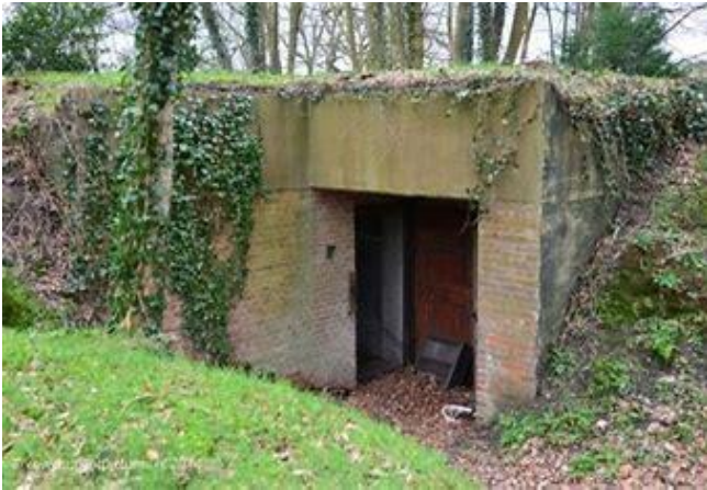
folly in het bos